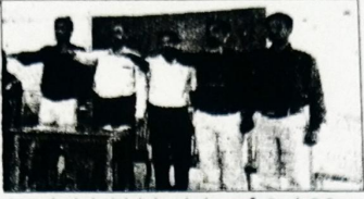
ವಿಜಯಪುರ ನಗರದ ಅಕ್ಕಮಹಾದೇವಿ ಮಹಿಳಾ ವಿವಿಯಲ್ಲಿ ನಡೆದ ರಾಷ್ಟ್ರೀಯ ಏಕತಾ ದಿನಾಚರಣೆಯಲ್ಲಿ ಬೋಧಕರು ವಿದ್ಯಾರ್ಥಿನಿಯರಿಗೆ ಪ್ರಮಾಣವಚನ ಬೋಧಿಸಿದರು.