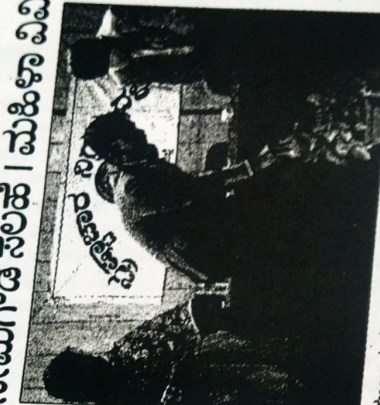
ಪ್ರಜ್ಞಾಚಾರ್ ನಿಯಂತ್ರಣ ಕುರಿತು ಜಾಗೃತಿ